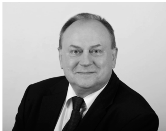
Jan Nowak – Prezes UODO od (od 16 maja 2019)